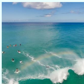
おすすめ サーフスポット案内