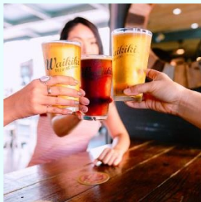
クラフトビール巡りツアー