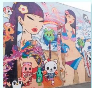
カカアコウォールアートで 一眼レフ撮影