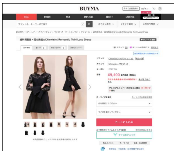
①商品ページの「サイズをチェック」ボタンをクリック