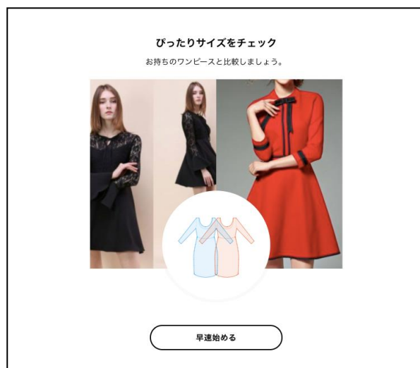
②購入履歴がある場合は、「早速始める」をクリックするだけ