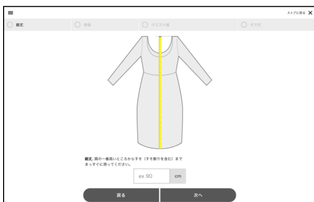
③お手持ちのアイテムを測って登録することも可能です