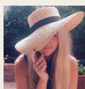
オーストラリア注目ブランド！ lack of color(ラックオブカラー) ストローハット http://goo.gl/lvC0jt