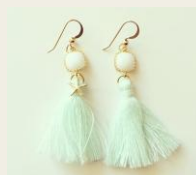
夏気分を盛り上げる！ 貝柄・ヒトデモチーフの ハワイアンジュエリー http://goo.gl/QsPW9D