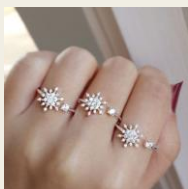
アメリカ発 「STYLE SOME1」/3,190円～ 華奢なシンプルジュエリー http://www.buyma.com/01