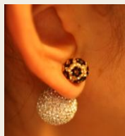
タイ発 「Spirituel」/6,500円～ 注文殺到で1ヶ月待ちのクリスタルピアス http://www.buyma.com/02