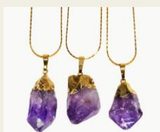
アメリカ発 「Crystal Cactus」/2,980円～ 世界に1つ天然石ジュエリー http://www.buyma.com/03