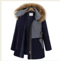
おしゃれに防寒 15,000円未満の プチプラアウター http://www.buyma.com/01