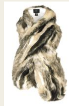
首まわりをほっこりカバー フェイクファーマフラー 2,980円～ http://www.buyma.com/03