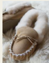
足元ポカポカ シューズ・スリッポン 4,780円～ http://www.buyma.com/02