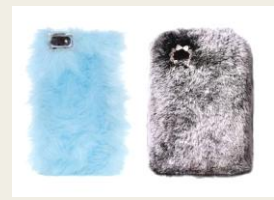
病みつきになる肌触りで人気上昇 スマホケース 980円～ http://www.buyma.com/04