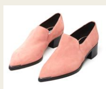
カジュアルになりすぎない スタイリッシュなローファー 3,800円～ http://www.buyma.com/03