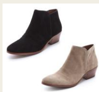
コーデに取り入れやすい エレガントなブーティ 4,780円～ http://www.buyma.com/02