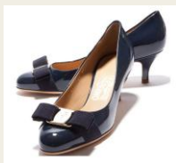
美しいシルエットで履きやすい 綺麗目パンプス 4,800円～ http://www.buyma.com/01