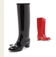
悪天候の日もお洒落に決まる ヒール付きのレインブーツ 3,980円～ http://www.buyma.com/04