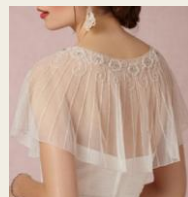
羽織るだけでフォーマルになるお洒落なポレロ・ショール 5,980円～ http://www.buyma.com/04