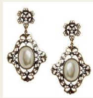
普段使いもできるパールモチーフのアクセサリ 650円～ http://www.buyma.com/03