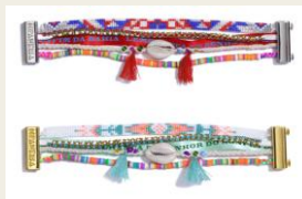
テレビで話題じゃら付け プレスレット HIPANEMA (ヒパネマ) 5,980円～