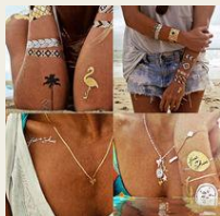
海外で話題のタトゥーシール 輝き4～6日間持続 2,200円～