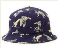
トレンドのバケットハット 日本未入荷モデルも豊富 4,200円～