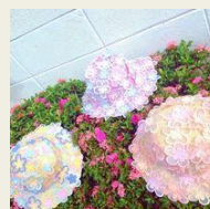
帽子やサングラスなど 可愛いファッション小物 6,300円～