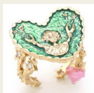
星座リングなど ユニークなアクセサリー雑貨 6,804円～