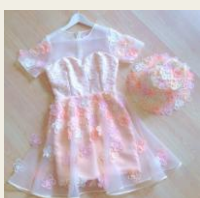
ラブリーなデザインが魅力 LoveMeTender (ラウミーテンドー) 8,500円～