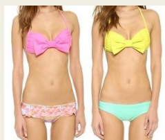
ブラジリアンビキニ セクシーで美脚効果抜群 http://www.buyma.com/01