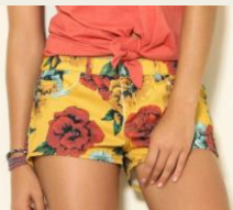
トレンドの「ボタニカル柄」 ブラジルテイストが旬 http://www.buyma.com/03