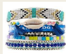
ブラジルからインスパイア サマープレスレット 6,800円～ http://www.buyma.com/04