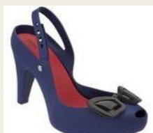
ブラジルといえばMelissa(メリッサ) 可愛いラバーシューズ 1,600円～ http://www.buyma.com/02