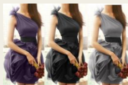
女性のあこがれVera Wang (ヴェラウオン) パーティードレス 27,350円～ http://www.buyma.com/02