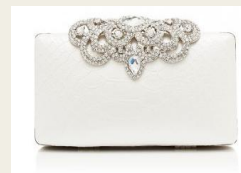
お手頃価格で使いやすい クラッチバッグ 6,800円～ http://www.buyma.com/04