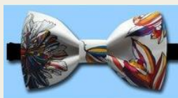
個性的な蝶ネクタイ 3,310円～ http://www.buyma.com/03