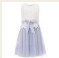
ロープライスがうれしい 15,000円未満のパーティードレス http://www.buyma.com/01