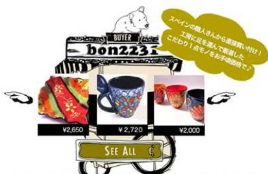
【スペイン】職人さんから直接買付けた食器類 / 2,000円～