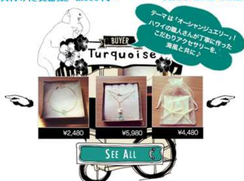
【ハワイ】職人さんが丁寧に作ったハワイアンアクセサリー / 2,480円～