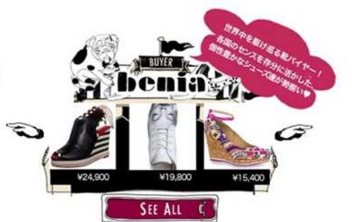
【世界】各国から厳選したデザインシューズ / 9,800円～